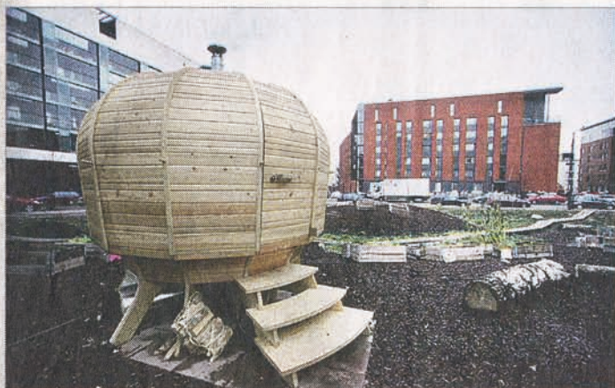
Kanto tupruttaa savua Muotoilijankadun koeviljelmätontilla. Kasvit kuolivat jo, mutta sauna saanee olla paikalla yli talven.